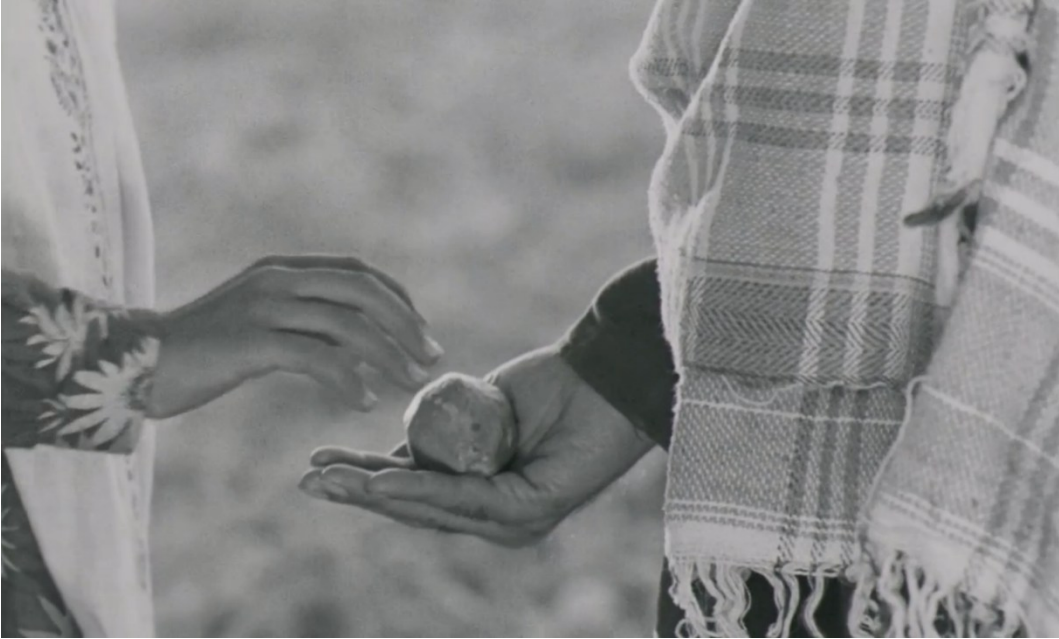
stte: Yankesici (Robert Bresson, 1959)