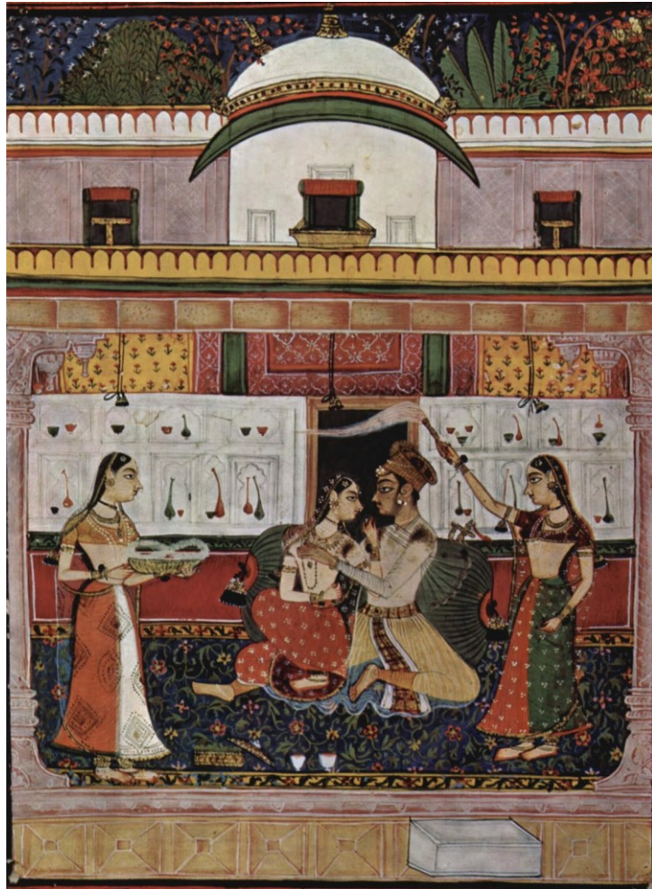
18. (üstte) ve 17. (altta) yüzyıllara ait Hint minyatürleri