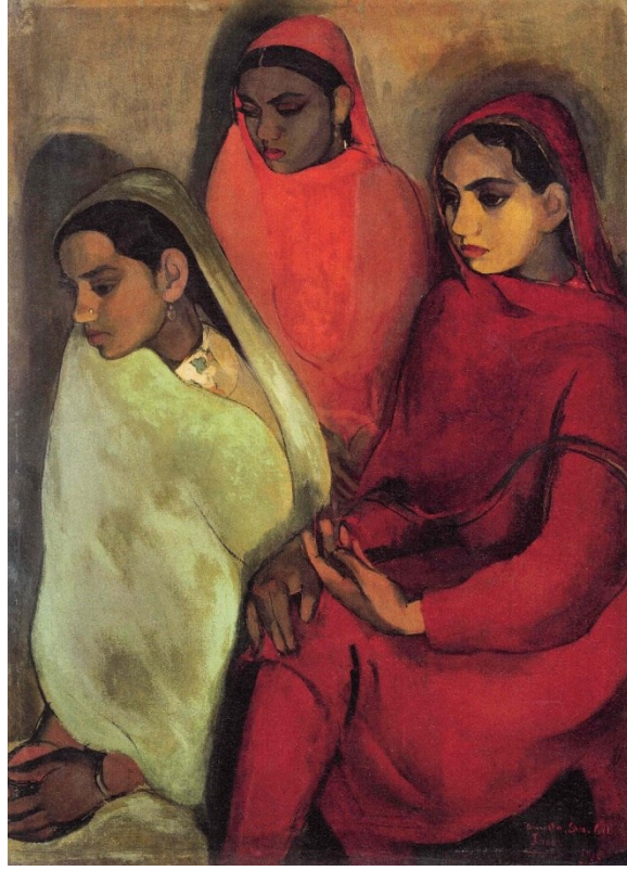
Üç Kız (Amrita Sher-Gil, 1935)