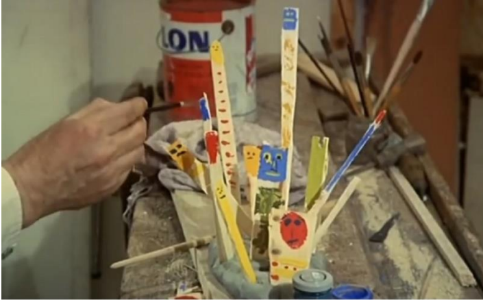
Sanatçı Richard'ın çalışması (filmden bir kare)

19. yüzyıldan itibaren, endüstri devrimi ve getirdiği yeni yaşam şekli, düşünce biçimlerini ve sanatı da etkileyerek, modernizmi ve "modern sanat"ı ortaya çıkardı. Modernizm, akli baş tacı etti. 20. yüzyılda yaşanan dünya savaşları, soykırımlar, hayal kırıklıkları, modernist anlatıya tepki olarak postmodernizmin ve "çağdaş sanat"ın gelişmesine yol açtı. Postmodernizm, aklın ve mantığın yeterli gelmediği bir dünyada doğdu. Juan Buñuel , heykeltıraş-ressam-fotoğrafçı ve sinemacı olarak çağdaş sanatçılar arasında ismi geçen biriydi. Bir röportajında, heykel ve sinema arasında hangisini seçeceği sorusuna verdiği cevap, sanat dallarını birbirinden ayıramayacağı şeklinde. Postmodern sanatın, disiplinler arası ve çok anlamlı olduğu düşünüldüğünde verebileceği tek cevabın bu olduğu açık. Hal böyle olunca, Juan Buñuel 'in diğer sanat dallarından ayrı düşünmediği sinemada da postmodern bir eser ortaya çıkarması şaşırtıcı değil.