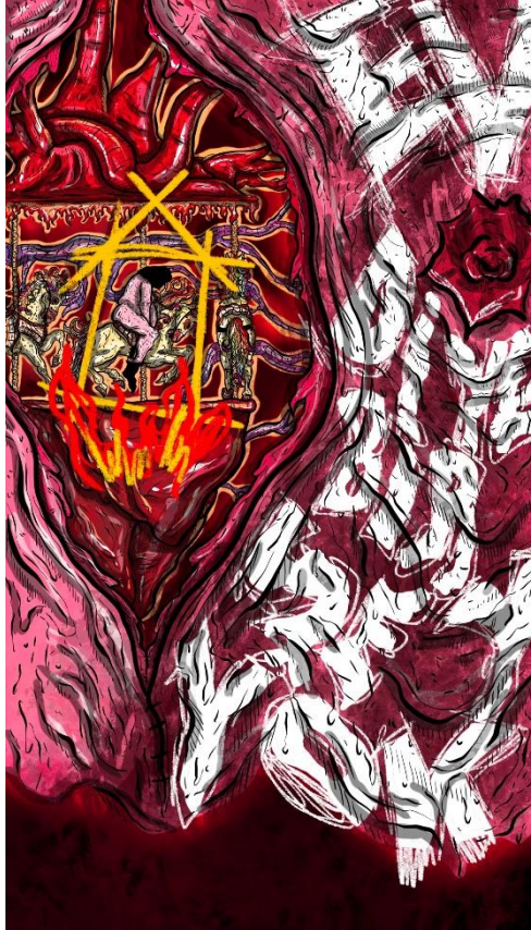
Ev Diye Bir Şey Yok (2022) film poster