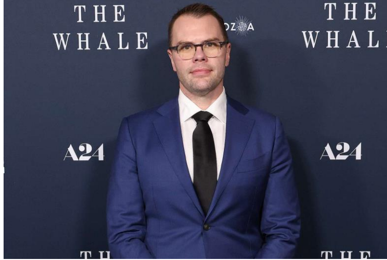
Balina filminin ve aynı isimli tiyatro oyununun senaristi Samuel D. Hunter

oluşan kutu gibi odada Charlie'ye eşlik eden kamera, seyircilerde ufak bir klostrofobi yaratmayı başarıyor ve bu şekilde Charlie'nin de bu odada ve kendi hayatında nasıl kapana kısıldığını gözler önüne seriyor. Filmin böylesine ufak bir alanda kısıtlanmış olmasının bir diğer sebebi de senaryonun, filmin senaristi Samuel D. Hunter 'ın 2012'deki tiyatro oyununu uyarlayarak hazırlanmış olması. Bu anlamda, bazı eleştirmenler filmin teatral yönlerinin fazlasıyla ön planda olduğunu ve de şematik olay örgüsü, alegorik/sözcü karakterler ve diyalog gibi teatral özellik taşıyan öğelerin filme yakışmadığı öne sürüyor. Öte yandan bu teatral öğeler filmi diğer beyaz perde yapımlarından ayırıyor; Charlie'nin yaşadığı kısıtlılığı ön plana çıkararak teatral sahnelemenin yanı sıra, Hunter 'ın tiyatrodan beyaz perdeye taşıdığı karakterlerinin çelişkileri ve karmaşıklıkları ve de beden ve ruh için yaşamak arasındaki uyumsuzluğun gözler önüne serilmesi de bunların bir parçası.