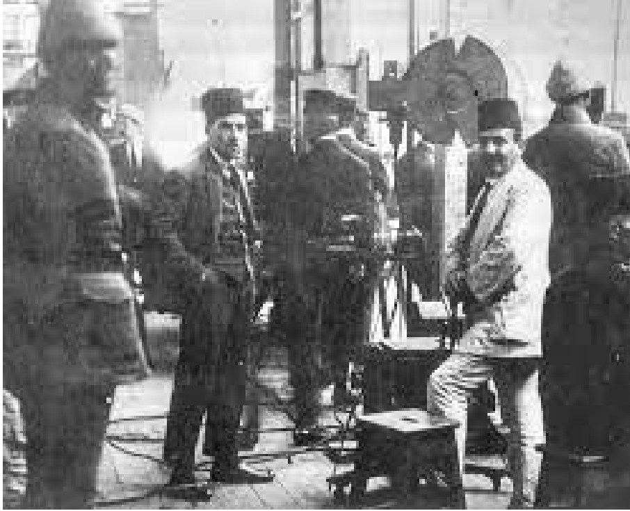
Merkez Ordu Sinema Dairesi'nde Bir Çalışma Anı

Enver Paşa Almanya'da görevli iken sinemanın ne denli güçlü bir propaganda aracı olduğunu yerinde tetkik etmiş ve yurda döndüğünde ordu içinde derhal bir sinema merkezi kurulması emrini vermişti. Kolordulardan seçilen teğmenler, o merkezde sinema sanatının tekniğini öğrenip, aletleriyle birlikte tekrar görev yerlerine döneceklerdi. Bu teknikler arasında film çekmek, yıkamak, pozitif basmak ve bunu projeksiyonda göstermek de vardı; yani bir sinemacıya gerekli her şey! 1915'te açılacak olan bu kurum, Türk sinema tarihini başlatacak, Fuat Uzkınay 'a çektirilen Ayastefanos Abidesinin Yıkılışı filmini ve daha pek çok kurgusal ve belgesel filmi yapacaktı. Fuat Bey, aynı zamanda kurumun idaresini de gerçekleştiriyordu ve yıllar sonra hatıratında, sinemacı tarafını her açıdan geliştirmesine yardımından dolayı kurumdan şükranla söz edecekti.