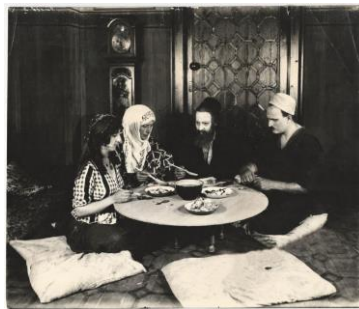
Kız Kulesinde Bir Facia