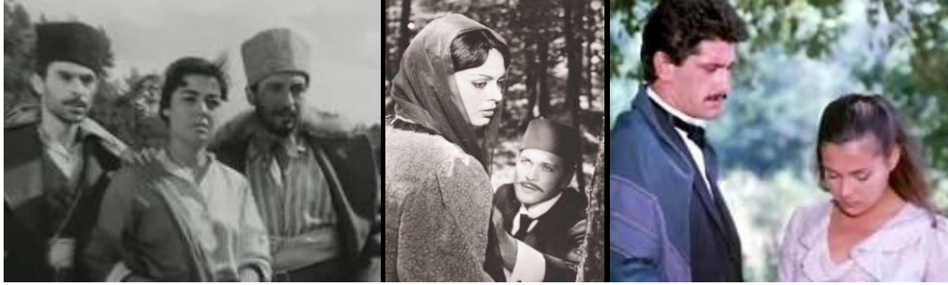
Düşman Yolları Kesti

de deneyen, Zeki Müren 'li, ortalığı kırıp geçiren şarkılı melodramlar ( Berduş , Altın Kafes , Gurbet ) üreten bu yapımevi, ticari başarı ile teknik kaliteyi birleştirir. Peki, öncü bir film şirketi olan Kemal Film'in otuz yıl kadar sonra yapımcılığa dönmesi ve zamanla sadece bu işle meşgul olması nasıl açıklanabilir? 1948-49 sezonuna kadar devamlı Mısır filmleri oynayan ve hasılat rekorları kıran Taksim sineması, artık Türk filmlerine de yer verir olmuştu. O zamanlar Anadolu'da film işletmeleri henüz açılmamıştı ve Anadolu sinemacıları sık sık İstanbul'a gelerek senelik ihtiyaçlarını buradan karşılardı. Bu sinemacılar gitgide yapımcılardan Türk filmi istemeye başladılar. Önceleri bu istekleri pek önemsemeyen büyük şirketler, zamanla etkilenmeye ve birbirlerinden gizli hazırlıklar yapmaya giriştiler. Fitaş ( İpekçi 'ler) zaten prodüksiyona açıktı. Lale Film , bir büyük prodüksiyona gireceğini ilan etti ve herkes 1933 ile 1949 arası RKO'nun Türkiye'deki tek dağıtıcısı olan Kemal Film 'in ne zaman kollan sıvayacağımızı merak eder oldu. Yani Kemal Film 'in yapımcılığa dönmesi kaçınılmazdı.