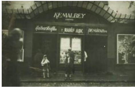
Şirketin salonlarından Kemalbey Sineması 1914 yılında Sirkeci'de açılmıştı.