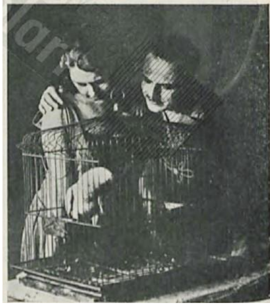
İstanbul'da Bir Facia-i Aşk

Kemal ve Şakir Beyler, Muhsin Ertuğrul'dan hemen ikinci bir film isterler. Ertuğrul ise bu işin devamı için kapalı bir platonun şart olduğunu belirtir. Eyüp – Defterdar'da Dokuma Fabrikası'na ait boş bir tezgâh ambarı, ardından da Birinci Dünya Savaşı yıllarında Müdafaa-i Milliye Cemiyeti'nin Bican Efendi filmini yapmak için getirttiği, kömür çubuklarla yanan Jüpiter markalı altı projektör kiralanır. Stüdyonun asgari koşulları oluşmuştur.