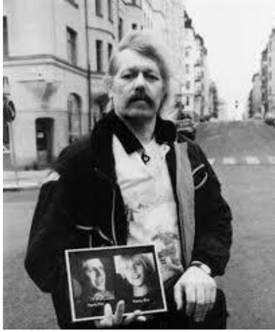
Sosyal Miras, Stefan Jarl, 1993

üretmeye devam ederken genç yönetmenler iki yüzlülük ve başarısızlıkları açığa çıkarmaya ve belgelemeye ve övünülen İsveç refah devletine meydan okumaya devam etmekteydiler.