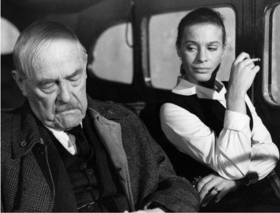
Victor Sjöström ve Ingrid Thulin, Yaban Çilekleri , Ingmar Bergman, 1957

Ardından Garbo ve Stiller , Louis B. Mayer tarafından Hollywood'a davet edildi. Böylece Ingrid Bergman , Ingmar Bergman , Max von Sydow , Bo Widerberg ve en son Stellan Skarsgård gibi oyuncu ve yönetmenler Hollywood'a taşınmaya başladı. Ancak İsveç sineması Amerika ve Avrupa etkisine kapılmadan kendi bakış açısını geliştirmeye de başladı. Açıkçası İsveç sinemasının ortak dili kültürel önceliğe sahipti. İsveç'in Birinci Dünya Savaşı'ndaki tarafsızlığı da sessiz sinemasının gelişmesine oldukça katkıda bulundu. Savaş döneminde diğer ülkelerin film üretememesi, İsveç'in kendi filmlerini üretmesi, dağıtması ve bir izleyici kitlesi geliştirmeleri için de uygun bir ortam sağlamıştı.