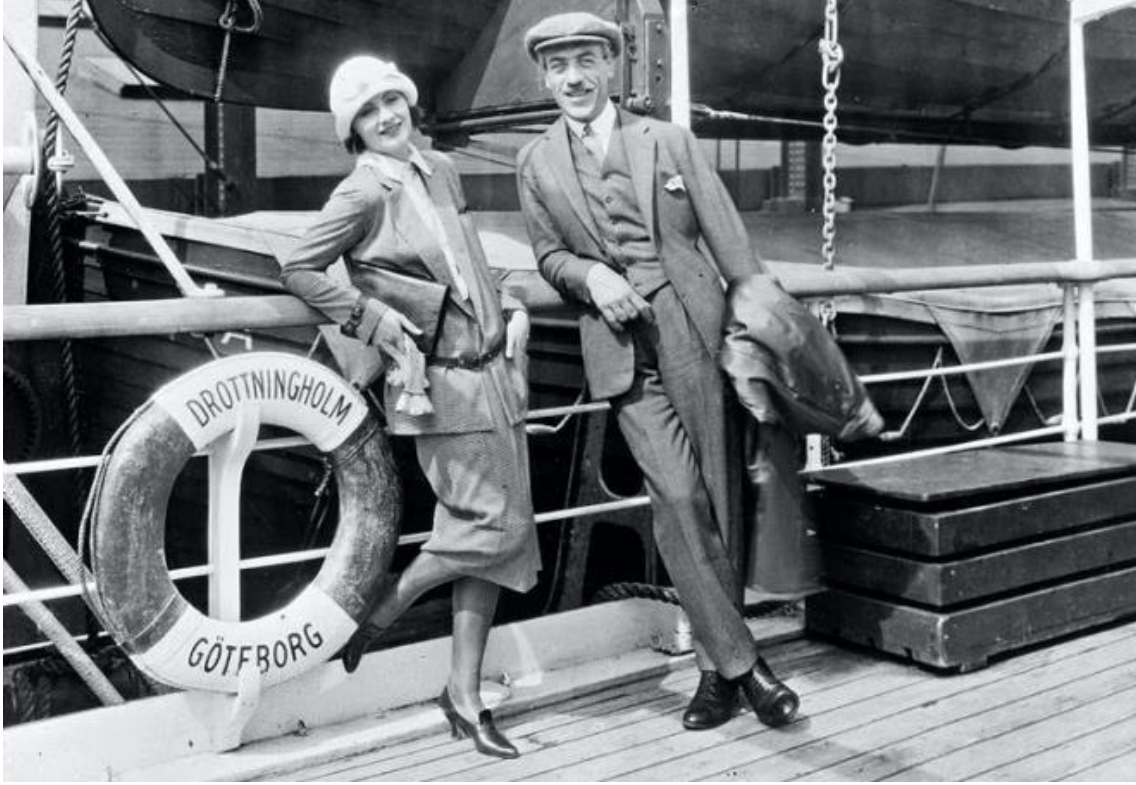
Greta Garbo ve Mauritz Stiller

açan Gustav Molander 8 ve onun melodramı Intermezzo (1936) ile birkaç yetenek ortaya çıktı. Ancak bu yıllarda İsveç sineması içe kapandı ve uluslararası itibarı hızla düştü. Sektör çalışanları bu durum karşısında, İsveç filmlerindeki düşük sanat standartlarını protesto etmek için Stockholm konser salonunda bir protesto düzenlediler.