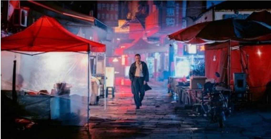
Uzun Bir Günden Geceye Yolculuk

"Dünya Festivallerinden" bölümündeki filmlerden Uzun Bir Günden Geceye Yolculuk 'u ( Long Day's Journey Into Night / Diqizuihou de ye wan , Gan Bi) görme şansını buldum. İzleyeni moddan moda sokan, muhteşem bir seyirlikti. Sondaki bir saate yakın, üç boyutlu gerçekleştirilmiş tek çekim, dakikliği ve sanat yönetimiyle seyredeni sarsıyordu. O gün seyrettiğimiz dördüncü film olmasına rağmen, bizi aymayı başarmıştı film. Adana'dan önce uğradığı Cannes'da da ilgi görmüştü film ve ünü kulağımıza ulaşmıştı. Yönetmenin ikinci uzun metrajı olmasına rağmen hayli yenilikçiydi.