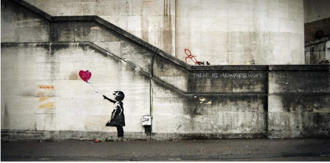
*Banksy, Kırmızı Balonlu Kız